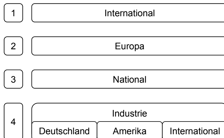
Abbildung 1: Clusterung der Organisationen

Die in der Abbildung 1 dargestellte Klassifizierung der Standardisierungsorganisationen in vier Gruppen oder Ebenen ermöglicht einen strukturierten Überblick.